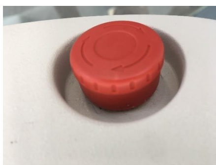
① 緊急停止ボタン ON の状態

BBLs を立ち上げるには、② (右側の写真) のように、黄色いラインが見える状態で鍵を右に回します。緊急停止ボタンが ON になっていて BBLs が立ち上がらない場合には、矢印に従い時計回りに緊急停止ボタンを回してボタンを引き上げ、ロックを解除します。